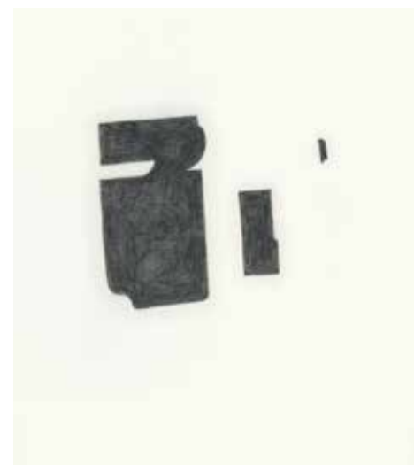
Historische und potentielle Wasserbereiche (gespiegelt)

Die Grafiken der Arbeit Parkscapes II - Gefüge sind auf der Grundlage einer vereinfachten topografischen Karte des Parks, einer Art Lageplan, entstanden. Dieser basiert auf Informationen aus unterschiedlichen Quellen, wie zum Beispiel Kartenma-