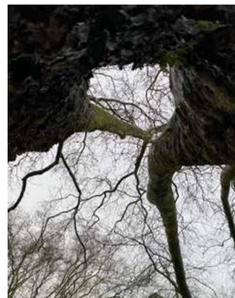
Äste und Stamm der Platane - Blick in Richtung Bankgebäude

Die Fotografie, die vermutlich ausgehend von der Rathaustrasse gemacht wurde, zeigt im Hintergrund das Gebäude der damaligen Reichsbank*. Zwischen Rathaustrasse und Reichsbank liegt in einer leichten Vertiefung die Fläche des Grilloparks. Nahezu alle auf dem Foto auszumachenden Elemente sind entweder heute nicht mehr vorhanden oder nicht mehr eindeutig zu identifizieren. Ausnahmen bilden das Bankgebäude und die Platane. Beide sind in ihrem heutigen Zustand noch existent, haben aber auch die beschriebene Transformation des Parks erlebt . An dieser Stelle spannt sich eine Berührung in der zeitbezogenen Verbindung von Platane und Gebäude auf. Die Idee hierzu ist, diese seit mehr als einhundert Jahren bestehende Ausrichtung - den Blick - der Platane auf das Gebäude nachzuvollziehen und die beiden Elemente mit einer künstlerischen Geste aufeinander zu beziehen. Dies anhand eines keramischen Objektes welches auf einem Abdruck der Platanenrinde basiert. Dessen extrudierter Objektkörper weist ausgehend von der Rindenabdruckstelle in Richtung des Bankgebäudes. Dieses Verbindungsobjekt wird