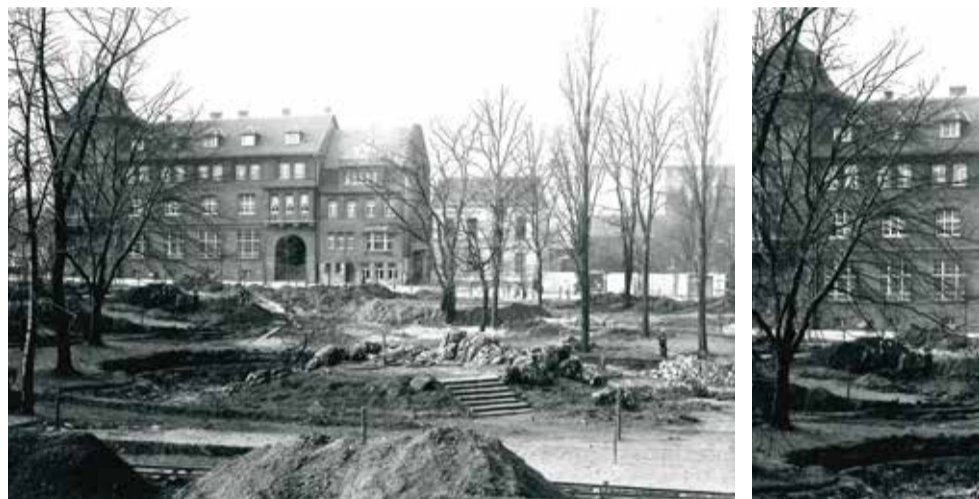
Umbauarbeiten im Grillopark im Frühjahr 1936 und Ausschnitt mit Platane